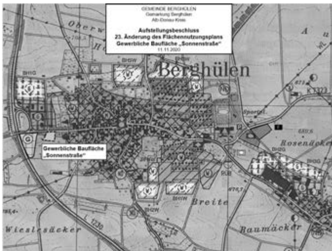
Ausschnitt 23. Änderung des Flächennutzungsplanes, unmaßstäblich, genordet

Der Geltungsbereich ist gemäß Änderungsbeschluss vom 11.11.2020 in dem Lageplan des Ing.-Büros Wassermüller Ulm GmbH vom 11.11.2020 / 24.03.2021 / 15.09.2021 festgelegt.